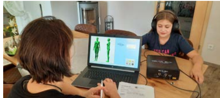
Auch für Kinder kann Bioresonanz hilfreich sein

Körper sämtlicher Organe und Organsysteme bis auf die Chromosomen- und Molekülebene. Es testet die Wirksamkeit und Verträglichkeit von Nosoden, Nahrungsergänzungsprodukten, Nahrungsmitteln, Therapien und Behandlungen, sowie Umweltbelastungen von Toxinen, Handys, Elektrosmog und vielem mehr.